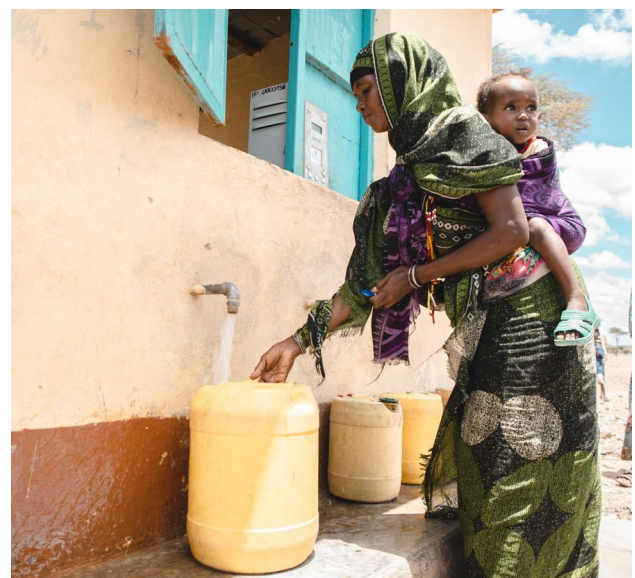
Eine Frau holt wertvolles Trinkwasser für ihre Familie.