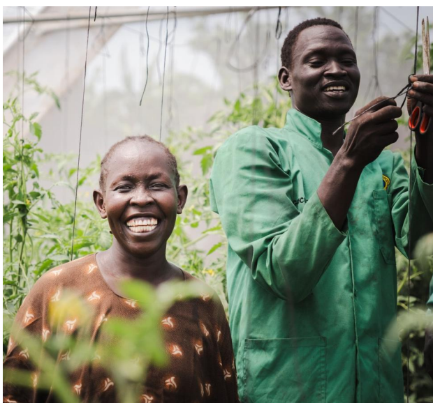
Lachende Frau inmitten grüner Pflanzen bei einem Landwirtschaftsprojekt