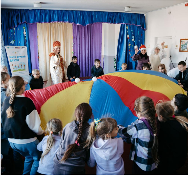
Safe Spaces für Kinder in ukrainischen Schulen sorgen für Bildung und Stabilität im Alltag

In sicheren, kindgerechten Räumen können sie spielen und werden gleichzeitig bei der Verarbeitung ihrer Ängste und Sorgen unterstützt. Zusätzlich werden im dritten Kriegsjahr weiterhin Notunterkünfte zur Verfügung gestellt sowie Winterhilfe und Unterstützung durch Bargeld und Gutscheine geleistet.