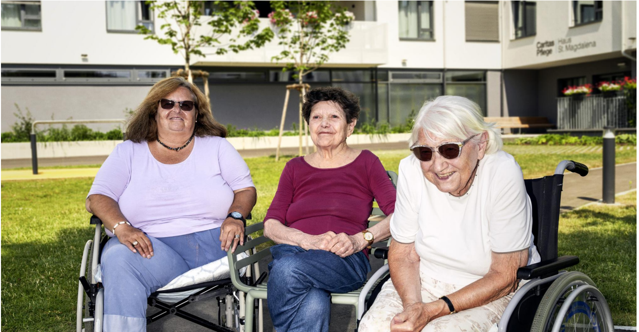
Caritas Pflege - wenn Omis zu Homies werden.