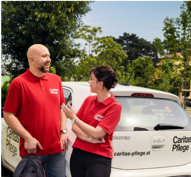
Caritas Pflege - auch mobil unterwegs

Struktur-Reform steht aber noch aus. Die ist notwendig, um Pflege und Betreuung auch in Zukunft sicherzustellen, denn die Nachfrage wird sich bis 2050 verdoppeln.