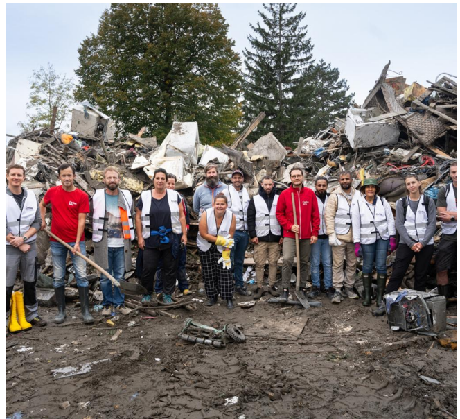
Eine Gruppe von ehrenamtlichen Helfer*innen, die nach dem Hochwasser in Niederösterreich bei den Aufräumarbeiten geholfen hat.

2024 hilft die Community österreichweit mehr als 10.000 Stunden direkt in Einrichtungen und Projekten der Caritas. Mehr als 540 Freiwillige packten etwa auch in der Hochwasserhilfe innerhalb kürzester Zeit tatkräftig mit an, schippten Schlamm, halfen beim Entrümpeln und versorgten mit Proviant.