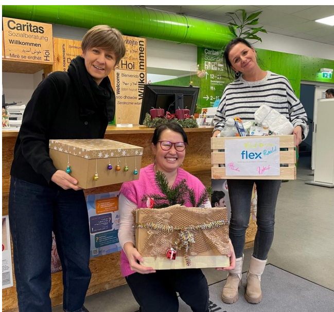
Umgekehrte Adventkalender für Klient*innen der Sozialberatung

Das dritte Jahr in Folge fand der „Umgekehrter Adventkalender“ statt, eine Aktion bei der Teilnehmende den Advent über Lebensmittel & Hygieneartikel sammeln und dann zu Weihnachten spenden. Rund 4.800 Kalender konnten wir an armutsbetroffene Menschen in ganz Österreich verteilen. Danke für eure Unterstützung!