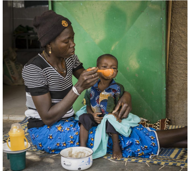
Viele Kindern in Burkina Faso leiden an Unterernährung - die Caritas hilft.