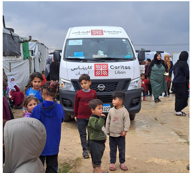
Die Caritas Österreich unterstützt im Libanon dauerhaft in den Bereichen Gesundheit, Bildung und soziale Sicherheit - und akut mit dem Lebensnotwendigsten.