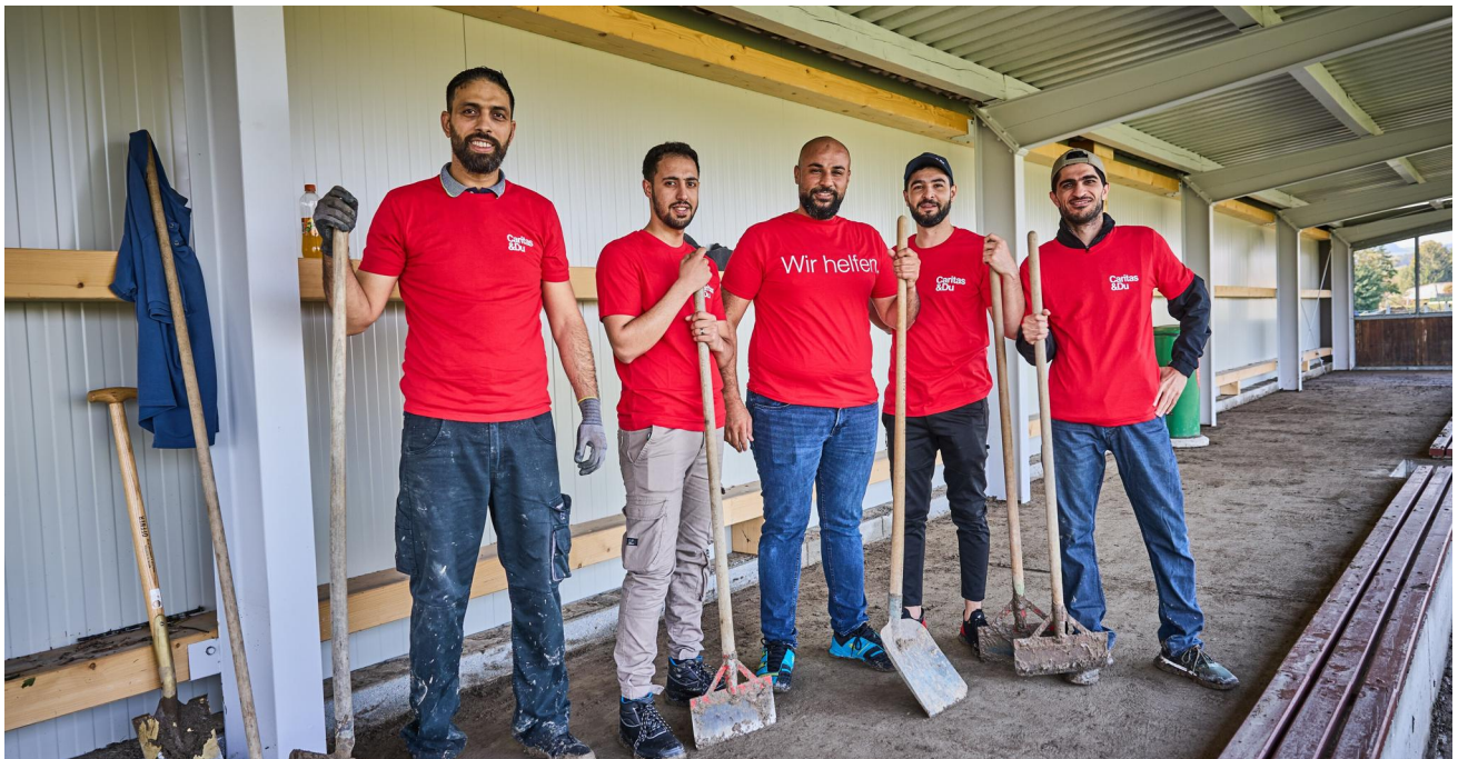
Freiwillige packten in der Hochwasserhilfe tatkräftig mit an.