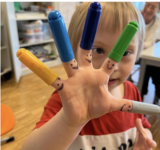
Inklusion wird an der Caritas Schule "Am Himmel" großgeschrieben.

Assistenz, passende Lernmaterialien und genug Zeit für individuelle Förderung. Denn wenn wir von Anfang an gemeinsam lernen, wachsen wir auch als Gesellschaft näher zusammen. Inklusion ist kein Extra – sie ist eine Haltung. Und sie beginnt mit echter Teilhabe von Anfang an.