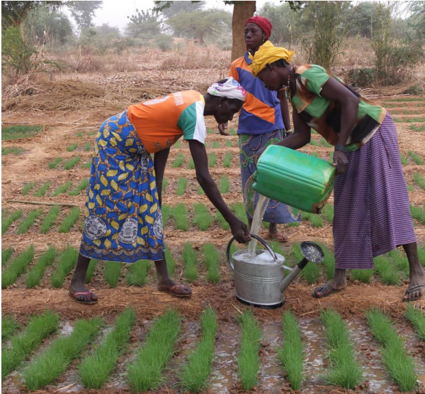
Nachhaltige Landwirtschaft sichert Überleben in Burkina Faso.