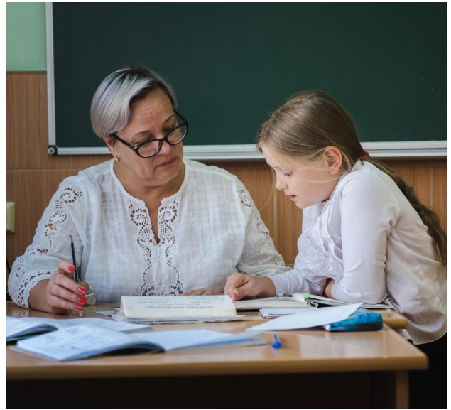
Bildung als Schlüssel zu einer besseren Zukunft.

Die Solidarität der Republik Moldau, eines der ärmsten Länder Europas, mit den geflüchteten Menschen aus der Ukraine ist groß, aber herausfordernd. Wir helfen ukrainischen Kindern dabei, ihre Bildung hier fortzusetzen – gemeinsam mit Kindern aus