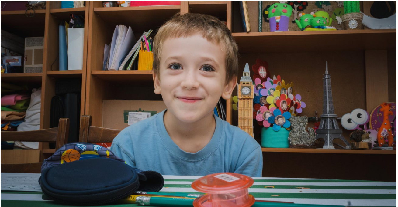
Schule gibt Halt inmitten der Krise und schafft wichtige Schutzräume.